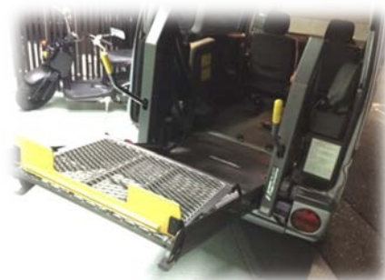
(まだカラーリングは施されていません)