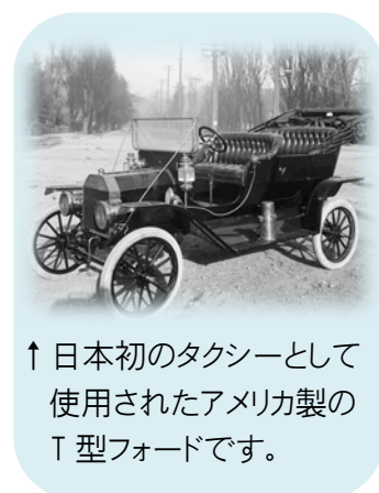
↑日本初のタクシーとして使用されたアメリカ製のT型フォードです。

今では目的や用途に合わせて多種多様なタクシーが走るようになりました。タクシーにも歴史ありということなのでしょう。 たまには快適に、目的地までタクシーを利用してみてはいかがでしょうか？フォレストの介護タクシーは、皆様のご依頼をいつでもお待ちしております。